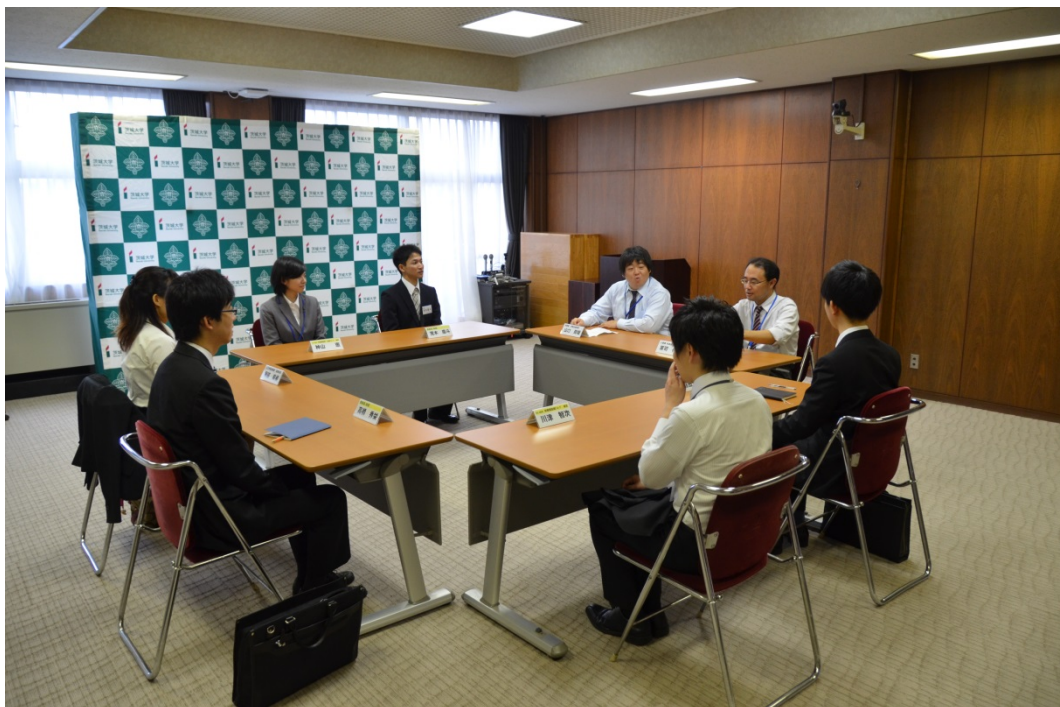
先輩職員等と採用内定者の懇談・質疑応答