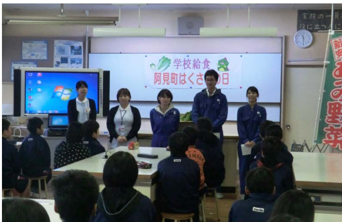
小学生へ授業を行う農学部と県立医療大学の学生ら