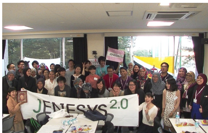
交流会終了後の記念写真