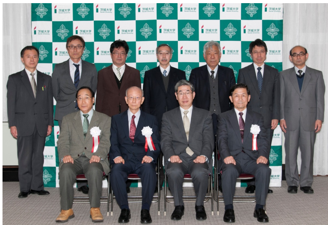
称号授与式後の記念写真