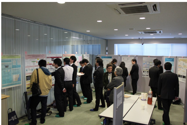
ポスターセッションの様子