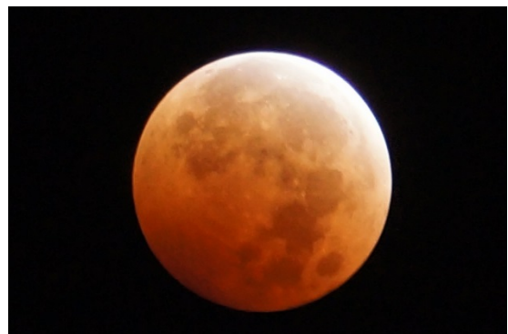
赤銅色に輝く皆既食時の月