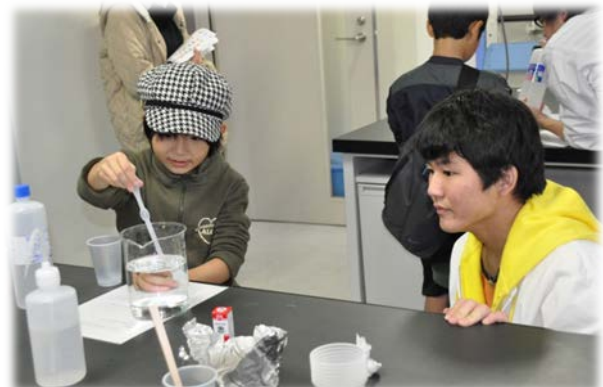
多くの児童たちが来場した化学サイエンスショー （第65回茨苑祭）