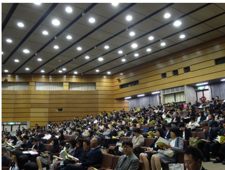
全体会での講話に聞き入る参加者たち