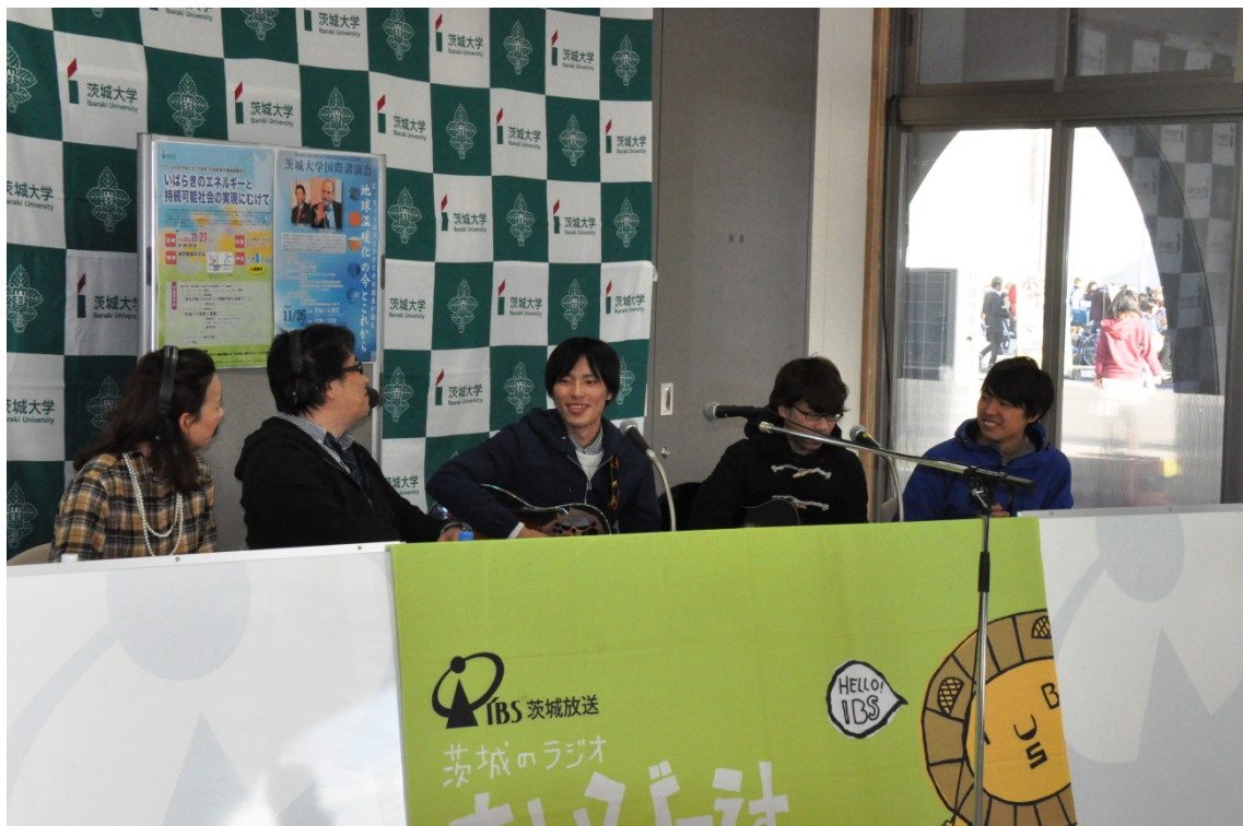
IBS 茨城放送による公開生放送

公開生放送スタジオには、地域住民の方が多数訪れ、ラジオで放送される茨城大学の取り組みについて興味深く聞き入っており、インフォメーションラウンジに展示されている研究成果や東京オリンピックとの連携協定紹介のパネルなども見学していました。