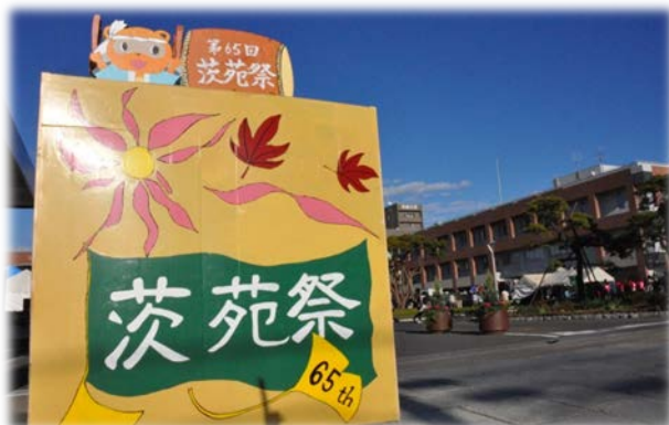
第65回茨苑祭（水戸キャンパス）