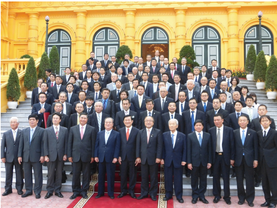
サン国家主席（中央）、政府高官らと茨城県訪問団による記念写真

本学は、現在、大学改革において茨城県が日本有数の農業県である特色を生かした農学分野の強化や、アジア地域を対象とした国際化に取り組んでいることから、この訪問の成果を積極的に活用していきたいと考えています。