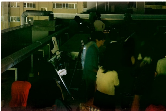
観望する教職員と学生たち

皆既食時は一時的に雲で月が隠れてしまったが、月食が終わる 21 時 30 分までの間、参加者は月食の美しさを十分に楽しみ、月が赤銅色に輝く神秘的な天体現象を教職員と学生がともに観望するという大変有意義な観望会となりました。