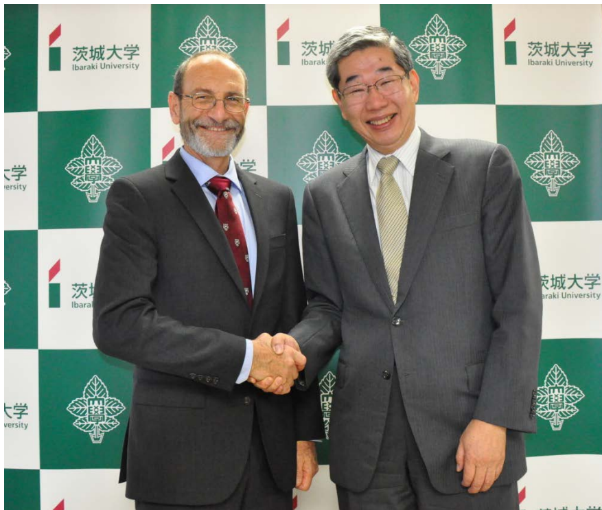
IPCC 第2作業部会共同議長であるクリストファー・フィールド博士（左）が来校されました（H26.11.26）