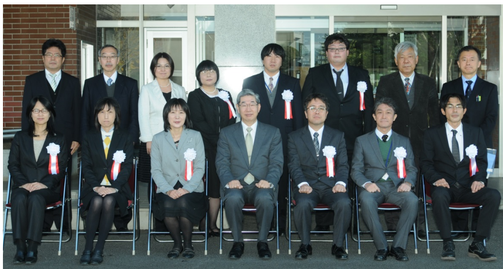
表彰式後の記念写真

表彰式に引き続き、昼食を取りながら懇談会が開催され、各理事からの祝辞をいただきました。また、各被表彰者からの挨拶が行われるなど、終始和やかな雰囲気の中で歓談が行われました。